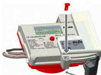
Verschließen und plombieren